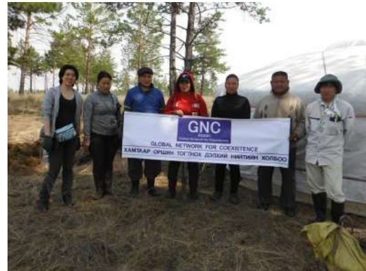
写真 12. 植林時の状況