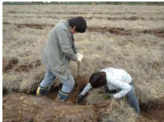
写真 10. 植林時の状況