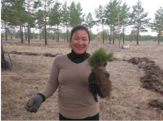
写真 7. 植林時の状況