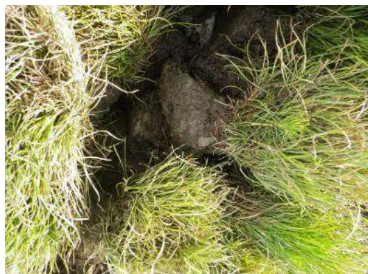
写真 5. 苗木の状況 (2013 年 5 月 9 日撮影)