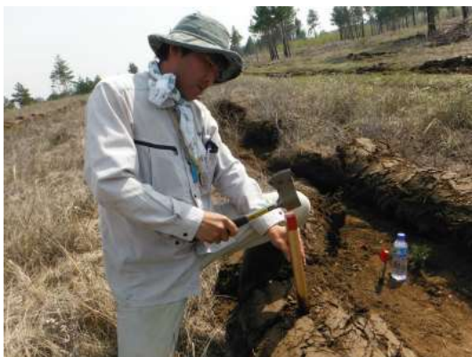
写真 6. 定点観測調査状況