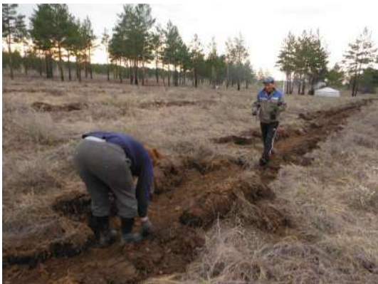
写真 9. 植林時の状況