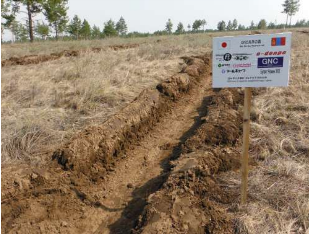
植林地写真「GNC 共存の森」