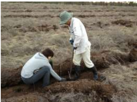
写真 11. 植林時の状況