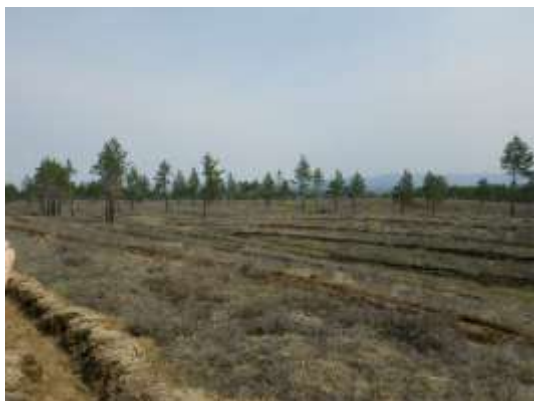
写真 4. 遠景写真 B