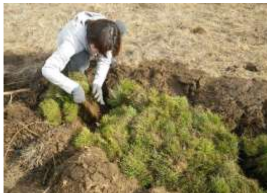
写真 1. 苗の仮保存状況 (2014 年 5 月 9 日撮影)