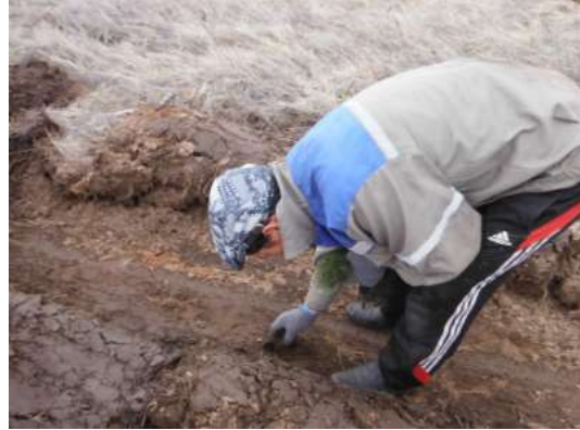
写真 8. 植林時の状況