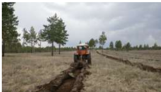
写真 2. 植林前の溝掘り状況 (2014 年 5 月 9 日撮影)