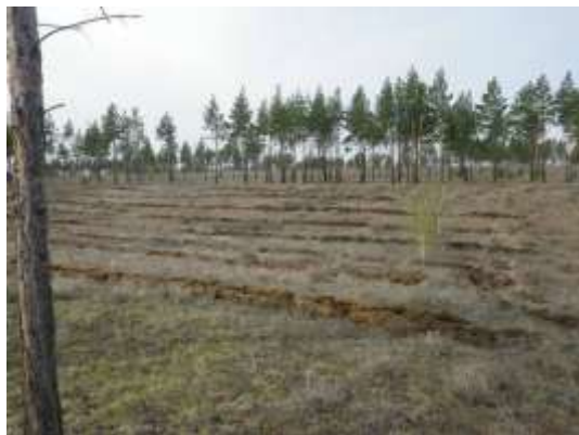
写真 3. 遠景写真 A