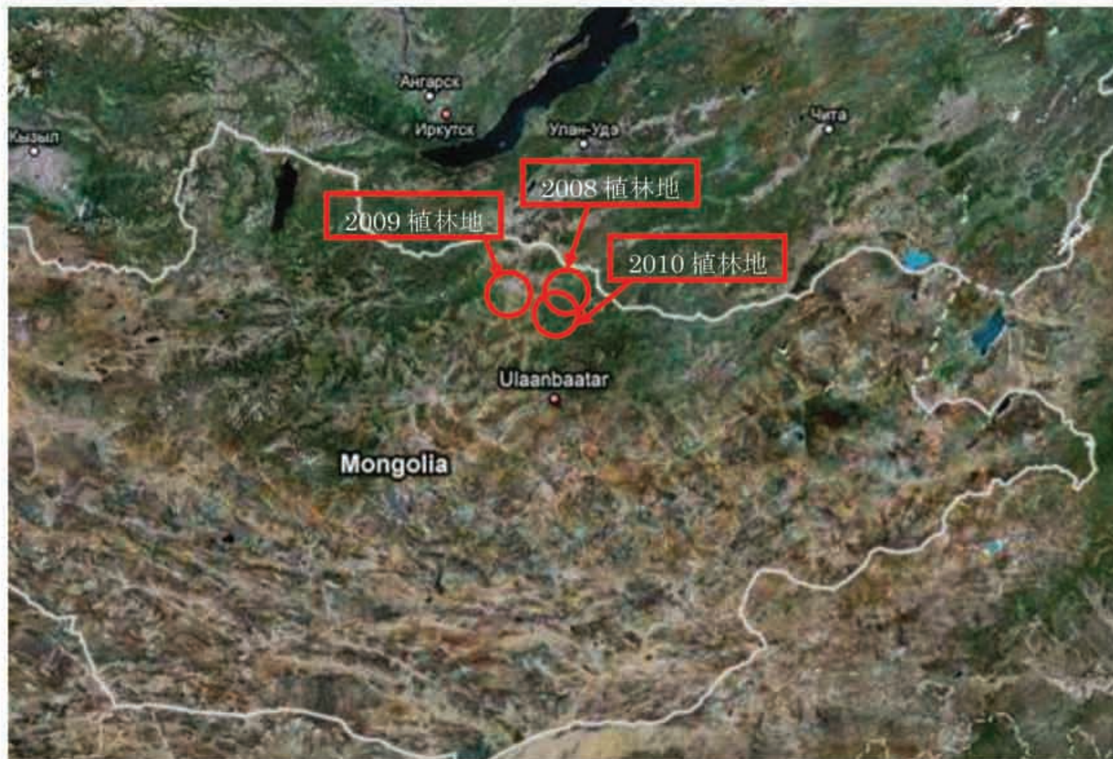
図 1. 広域図 (2008,2009,2010年植林地)