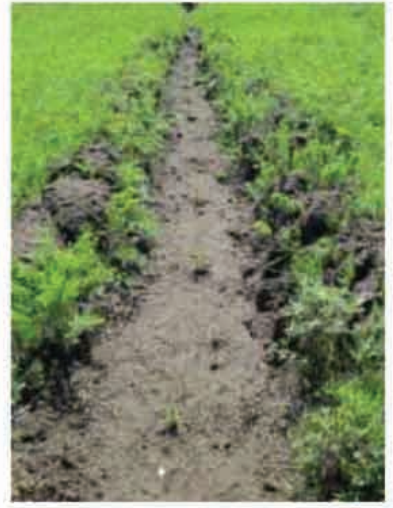
南北の溝を掘り、溝の底に植林することにより、日射を減らし乾燥化を防ぐ