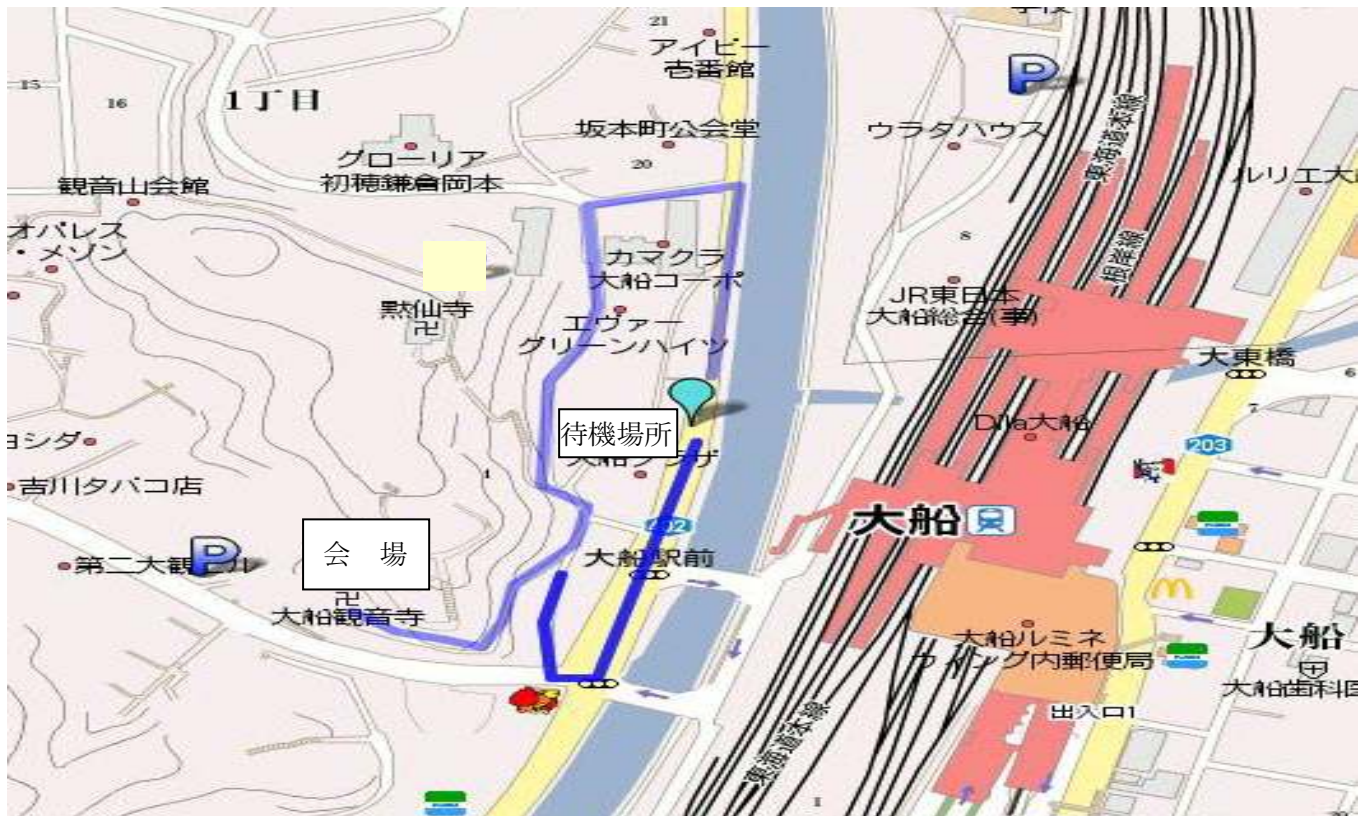
ゆめ観音アジアフェスティバル 会場案内図